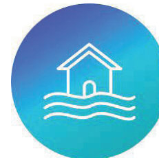
Les autres acteurs : Le conseil départemental, les syndicats de rivières, les gestionnaires de digues, etc.